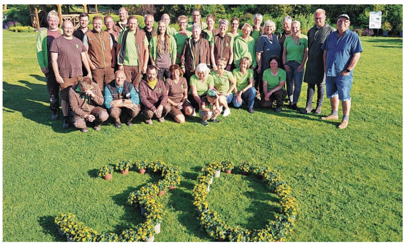
Individuelle Persönlichkeiten: Das Green Team.