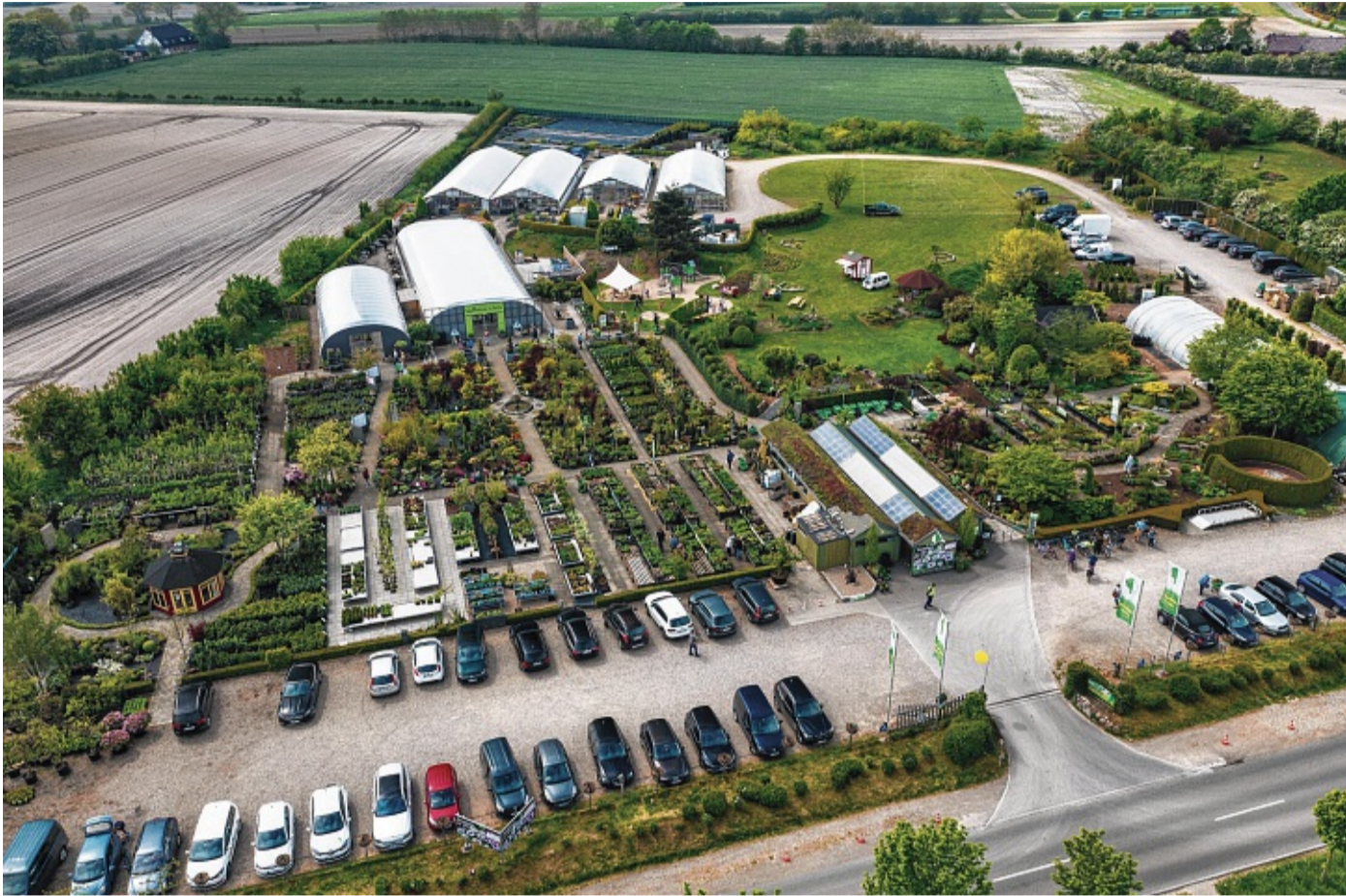
Das Areal hat sich in den vergangenen Jahren von 10.000 auf 23.000 Quadratmeter erweitert.